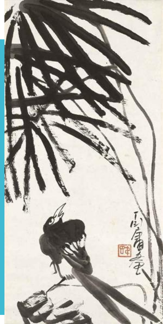
Bird under Tree, Ding Yanyong