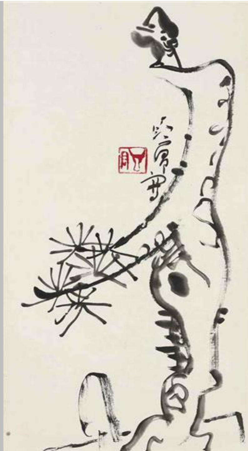
Bird on a Pine, Ding Yanyong