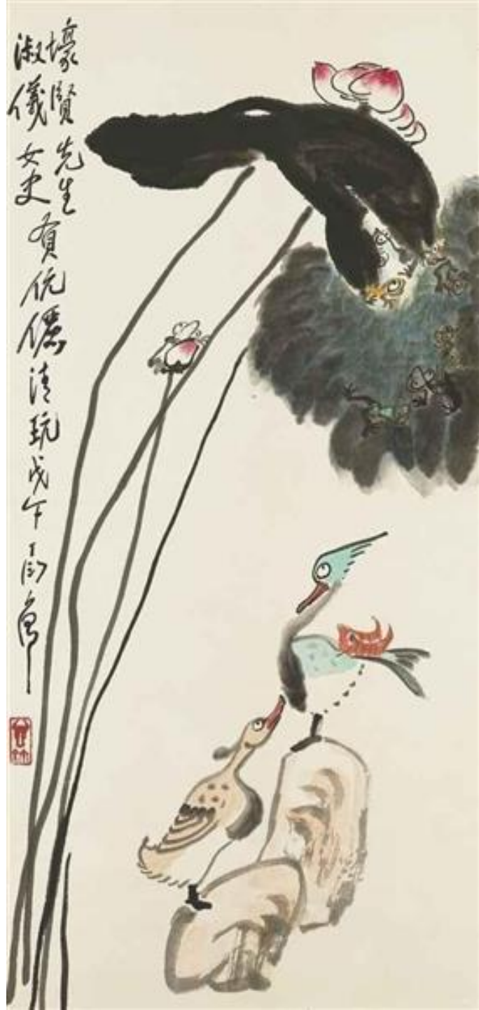
Lotus, Frogs and Mandarin Ducks