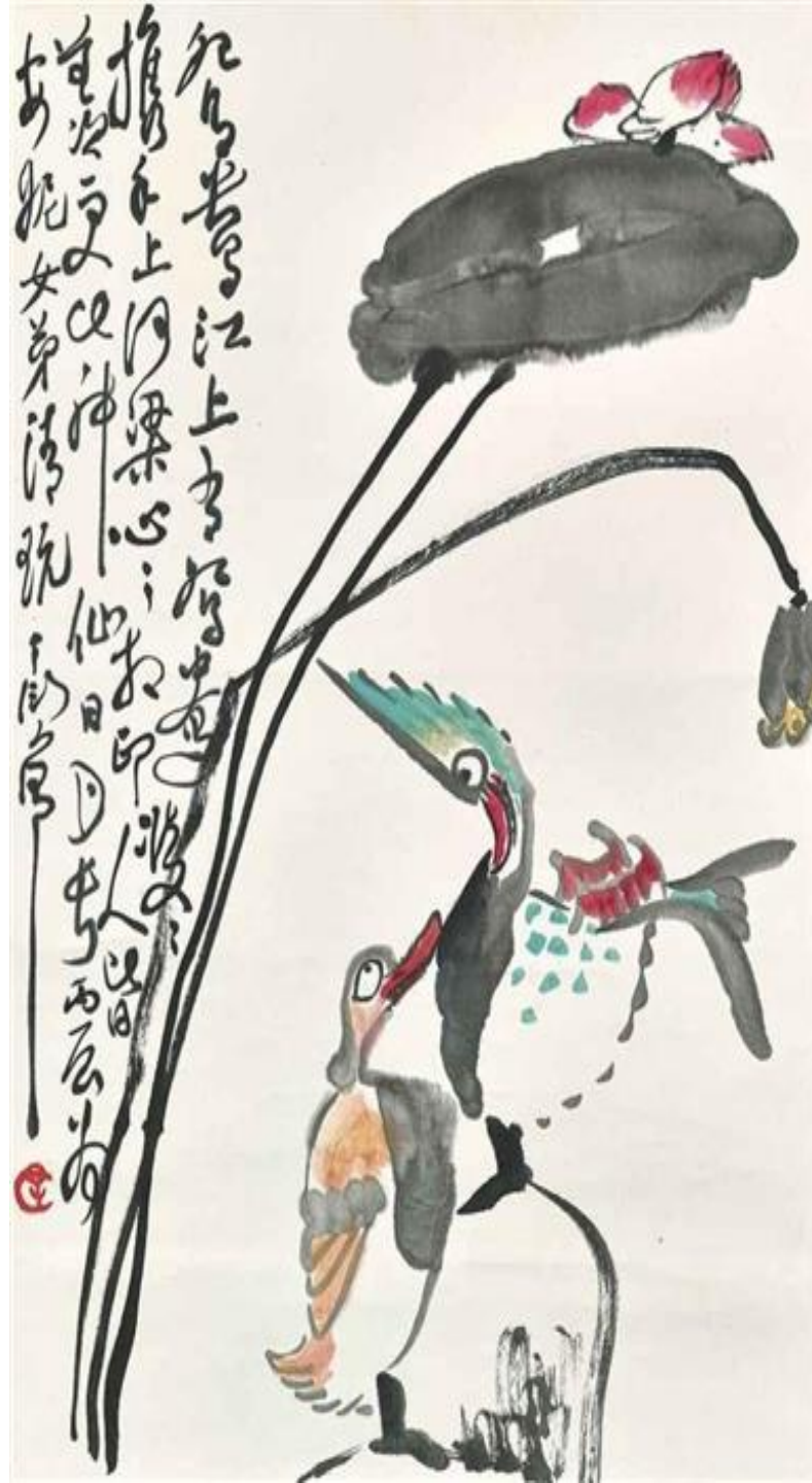
Lotus and Ducks