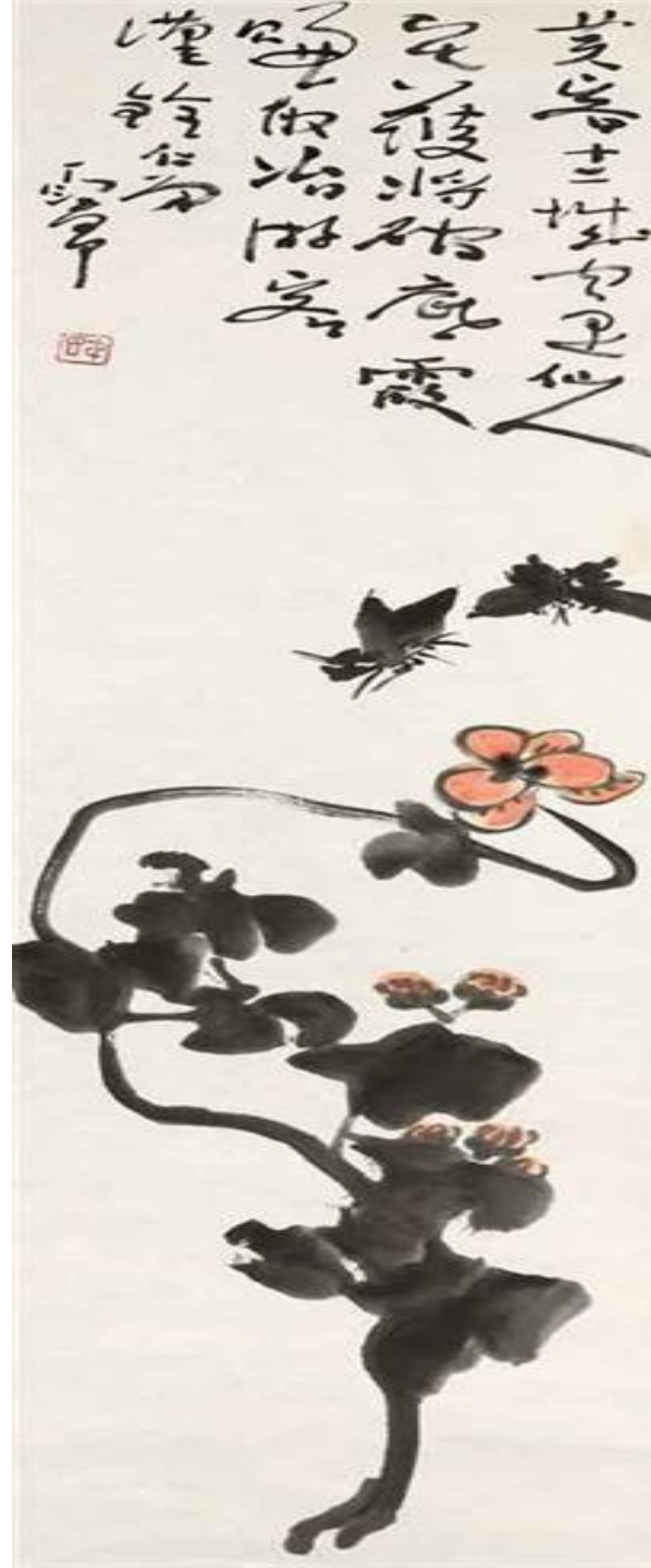
Butterflies and Hibiscus