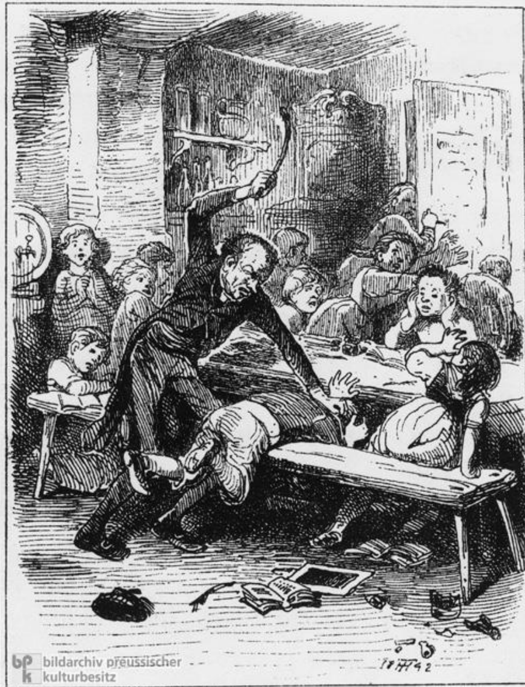
A Teacher Administers a Beating (1842). Litografía de Theodor Hosemann (Alemania)