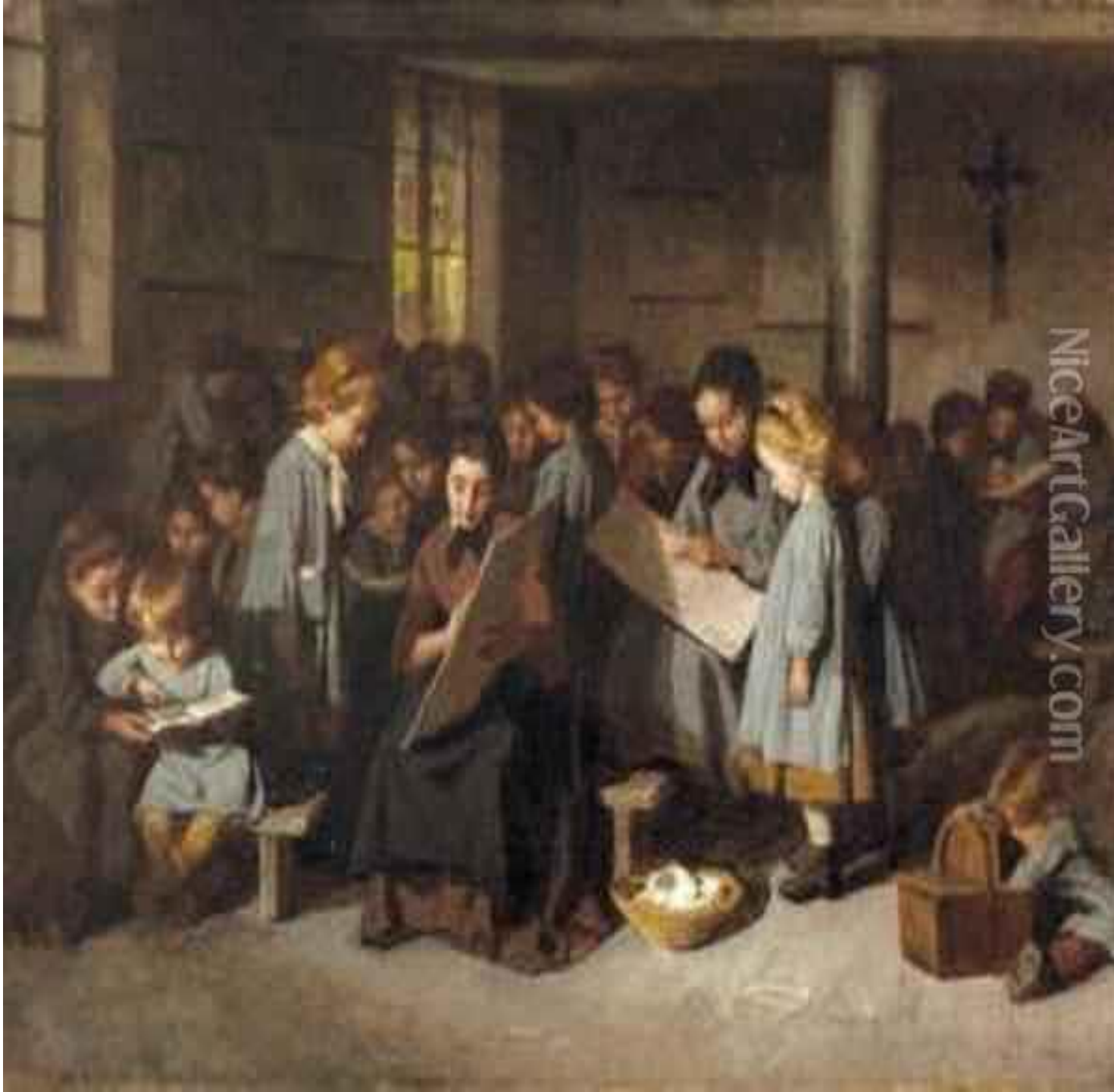
La Classe D'ecole, de Edouard d'Apvri (1874) (Francia)