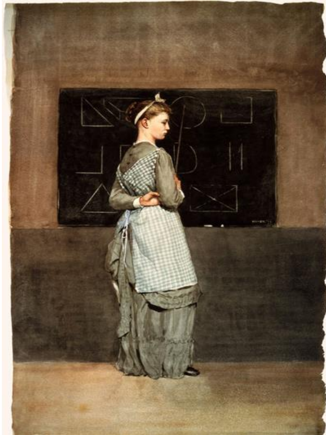
Blackboard, de Winslow Homer (1877) (EE.UU.)