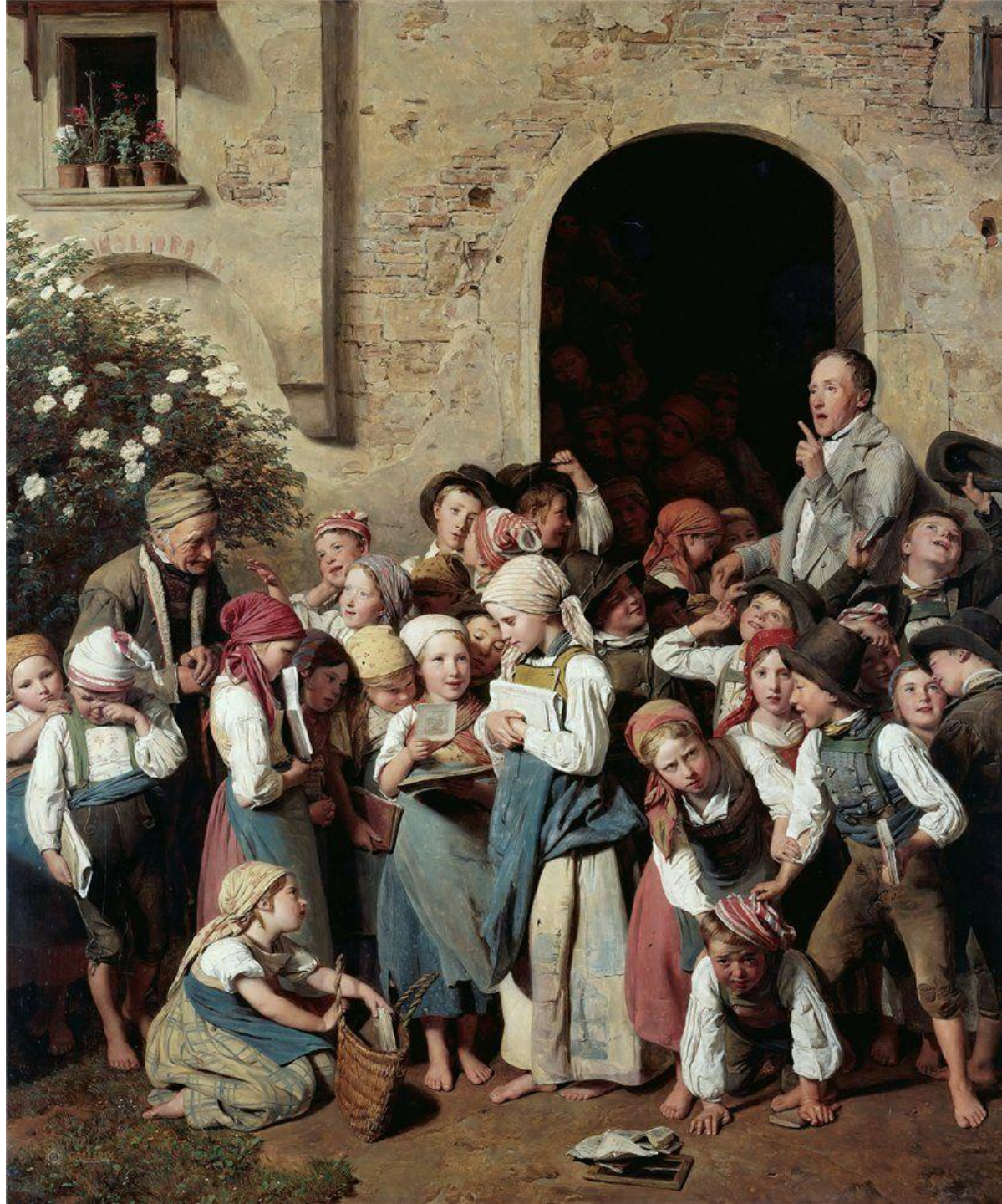
Salida de la escuela, de Ferdinand Georg Waldmüller (1841) (Austria)