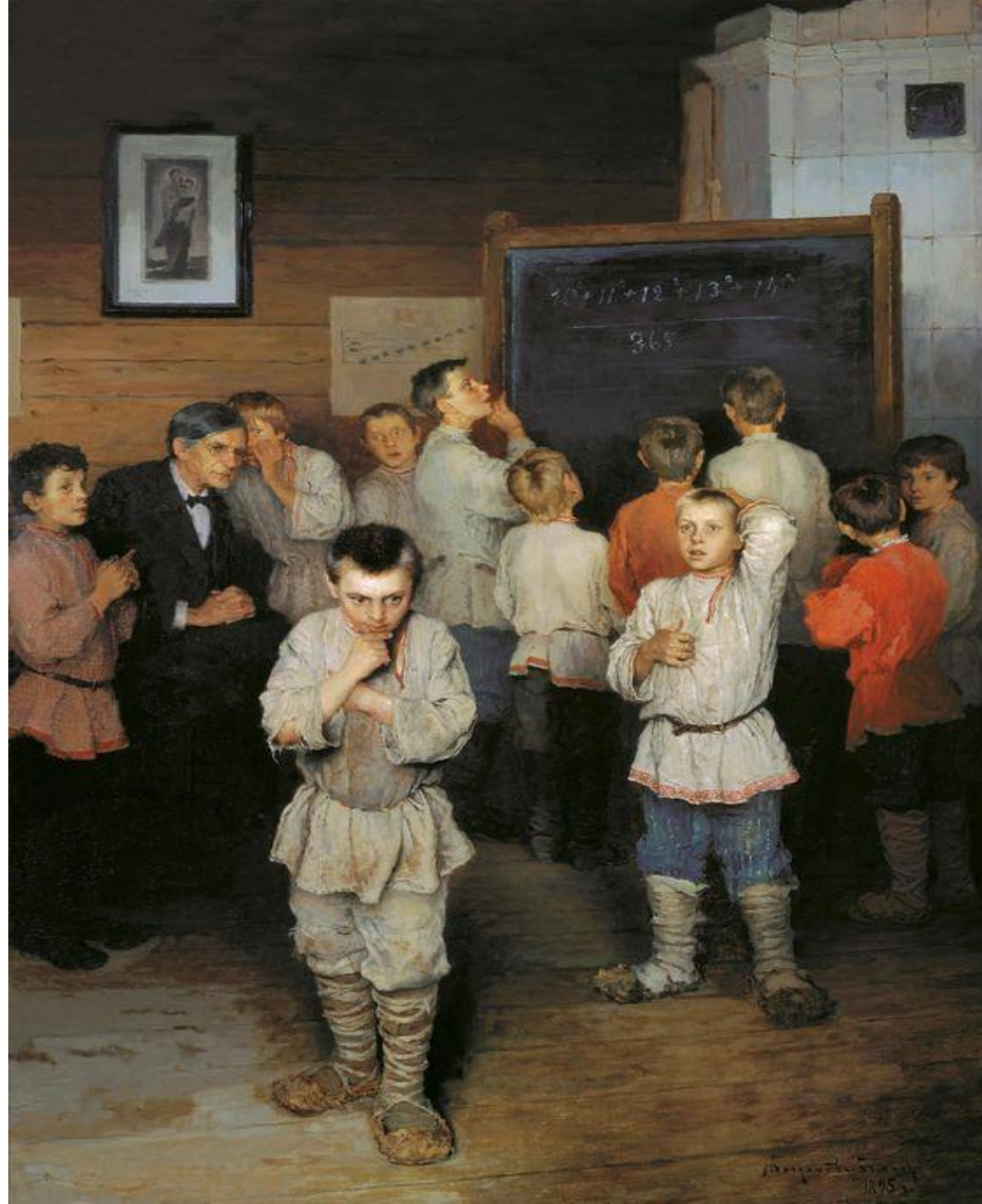
Mental Arithmetic, in the Rachinsky School, de Nikolay Bogdanov-Belsky (1895) (Rusia)