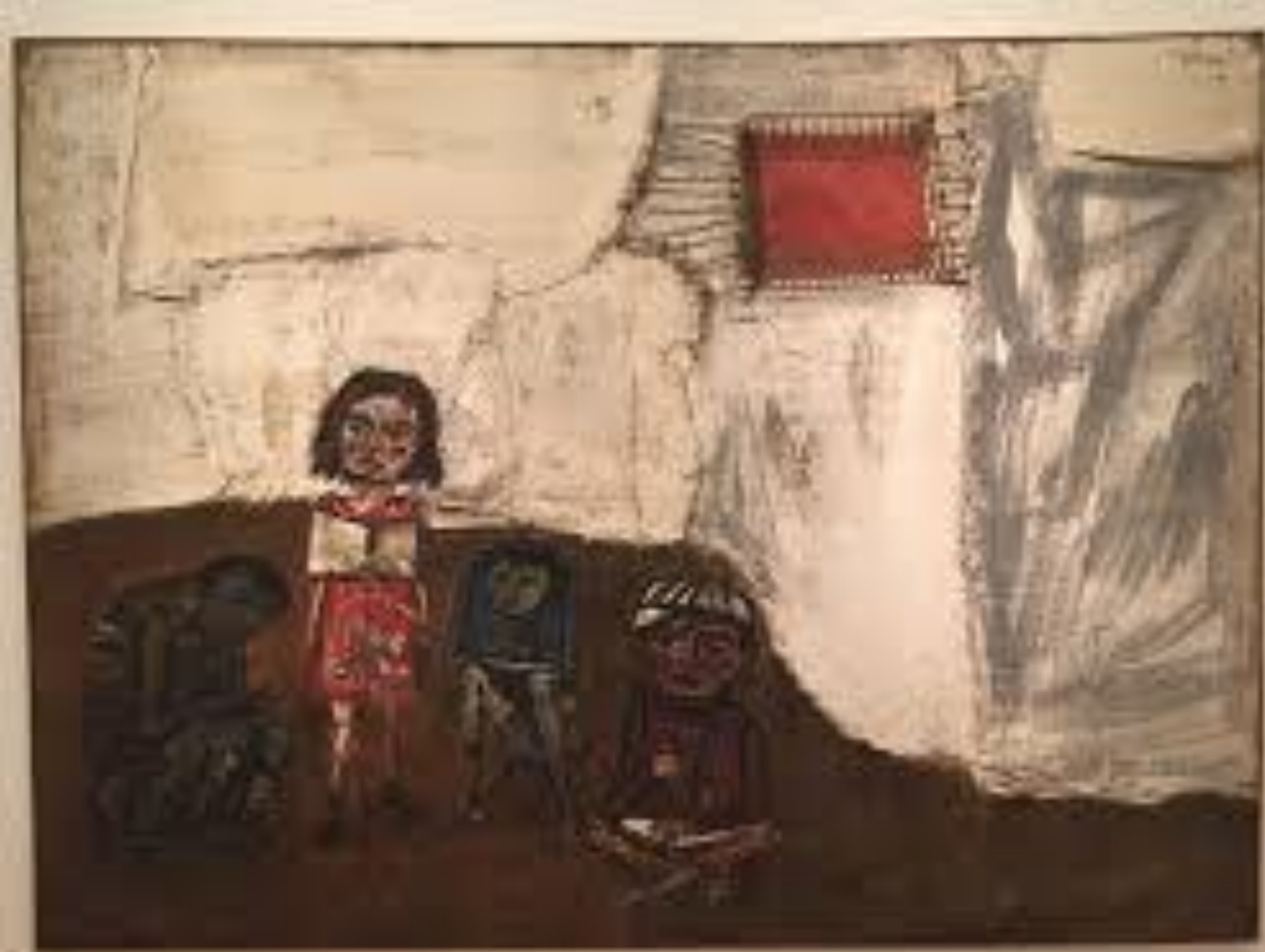
Juanito Laguna aprende a leer (1961). Antonio Berni