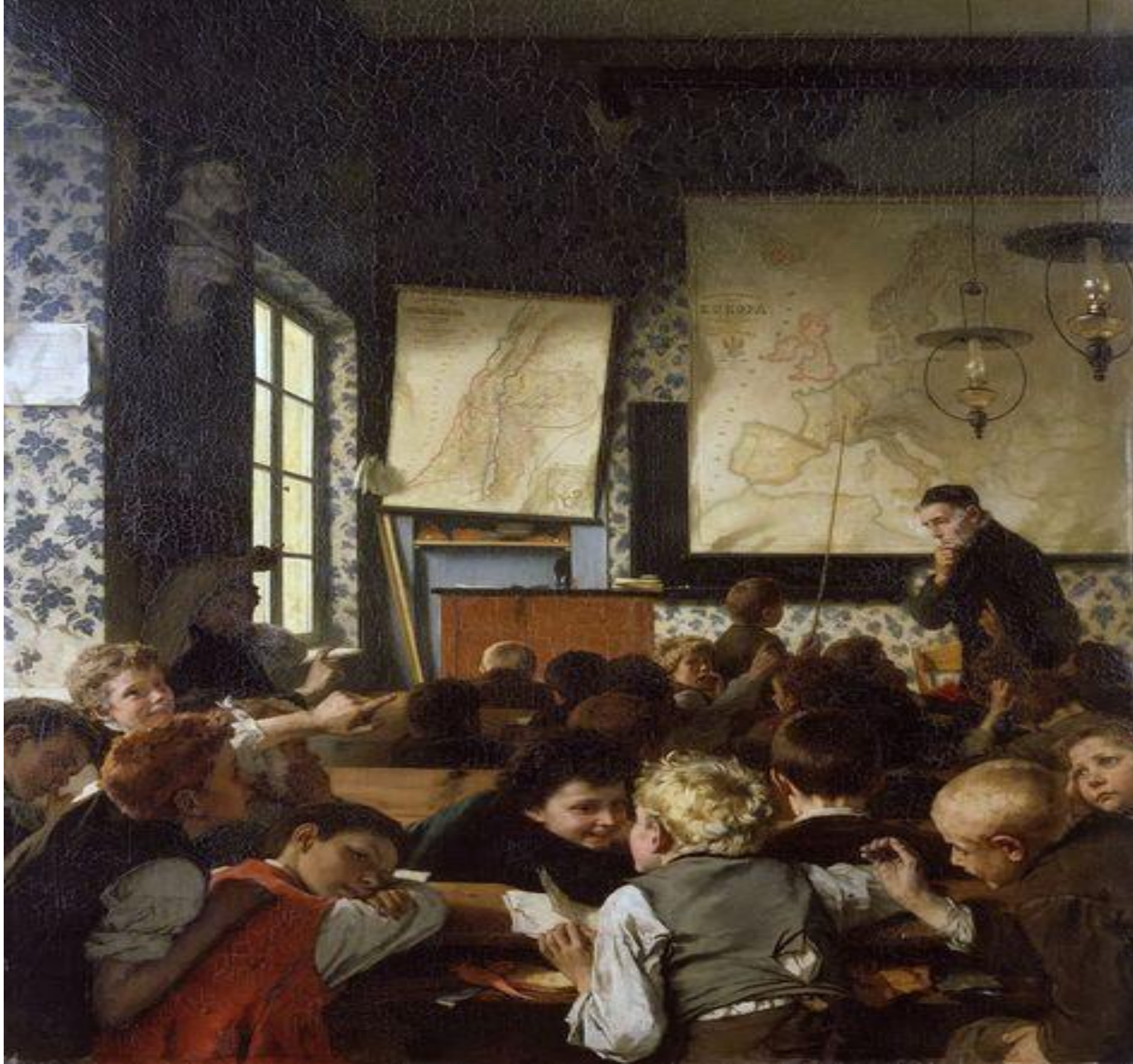
Classe pendant une leçon de géographie, de Karl Hertel (1874) (Alemania)