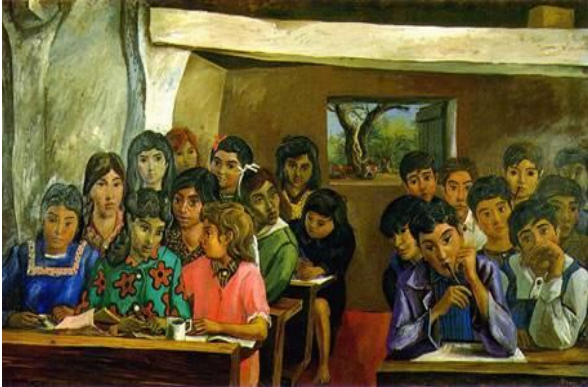
Escuelita rural, de Antonio Berni (1956). Neorrealismo