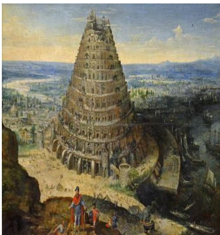
“La Tour de Babel”, de Van Valckenborch

Vamos a revisar los materiales de cátedra, e ir punteando ciertas aproximaciones, ciertas disquisiciones, relativas a conceptos que, siempre se espera, conozcan, para posibilitar que coloquen a operar, sean articulados con sus prácticas de enseñanza. Por ahora, de manera provisoria, en la prefiguración (no “preconfiguración”) de la práctica, en la planificación.