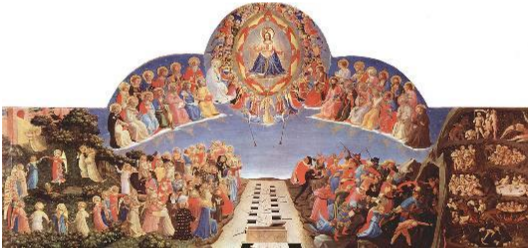
“El juicio final”, de Fra Angelico

Esta es la imagen que distingo entre muchas otras cuando googleo buscando “evaluación- juicio de valor”, porque refiere a aquel sentido tan caro a los cristianos, desde el que se nos evalúa y sanciona en función de nuestros actos: algunos serán salvados, y otros condenados.